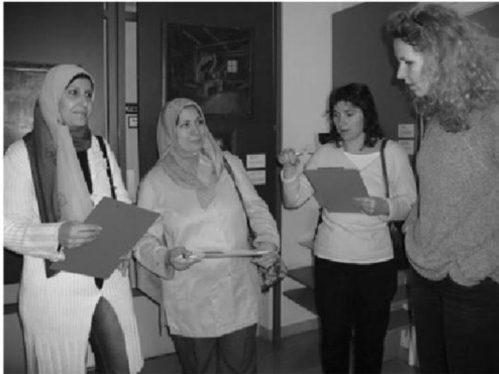
Auch für Erwachsene! Deutschlernende im Volkskundemuseum

www.volkskundemuseum.at kulturvermittlung@volkskundemuseum.at Tel +43 1 4068905.26