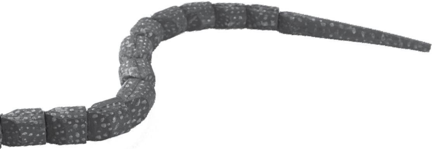
ÖMV/34.916, russische Kriegsgefangenenarbeit: Gliederschlange hergestellt 1916 in Brunn am Gebirge