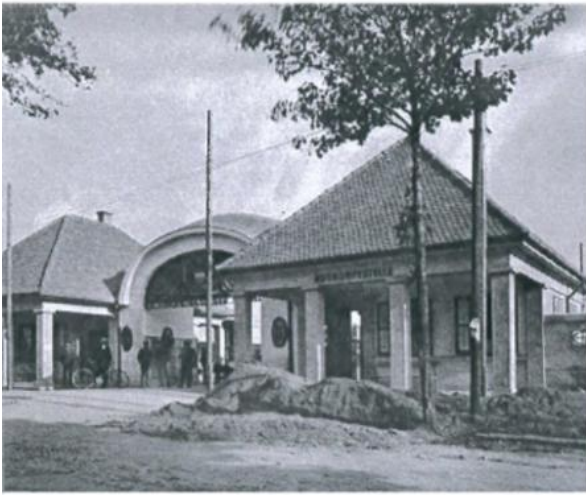
Eingang Flüchtlingslager