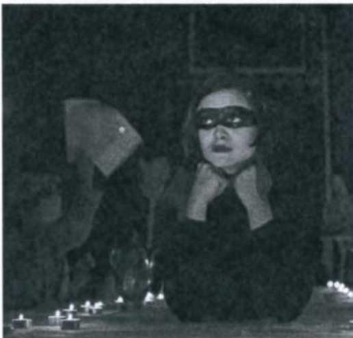
Videoclip „Invisible“ © Luise Pop

Rundgänge halbstündlich, letzter Start um 14 Uhr, Dauer: ca. 45 min, max. 20 Personen/Führung; Eintritt und Führung sind kostenlos, auch die Sonderausstellungen sowie die Dauerausstellung können besichtigt werden.