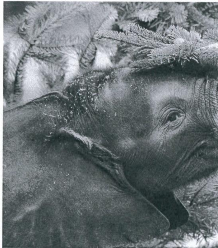
Afrikanischer Elefant; Tiergarten Schönbrunn

Wie sehen die Tätigkeiten der Christbaumbauern aus? Welche Baumarten eignen sich? Welche Bedeutung hat der Baum als Festelement, und was geschieht mit ihm nach den Feiertagen? In der Baumschule im Museumsgarten zeigen wir die Entwicklungsstufen vom Setzling zum Verkaufsbäumchen. Wir beleuchten die Geschichte des Weihnachtsbaumes, seine Rolle im öffentlichen Raum und die Entwicklung zum Symbolträger für eines der wichtigsten Familienfeste im Jahreslauf. Seit wann wird er geschmückt und womit? Wie wird er entsorgt und nachgenutzt? Die Museumsgäste sehen historische Objekte (z.B. Werkzeug und Krippenfiguren) sowie kunsthandwerkliche Originale (Bäume aus Keramik, Glas und Holz) aus den eigenen Museumssammlungen. Die Präsentation umfasst interaktive Kreativbereiche für Groß und Klein, die das Thema mit allen Sinnen erlebbar machen. Gestalten Sie Ihren eigenen Weihnachtsschmuck aus Recyclingmaterialien für die Ausstellung oder zum Mitnehmen!