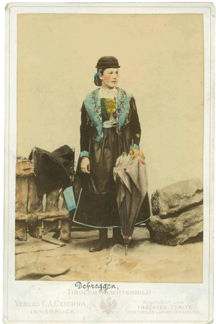
C. A. Czichna (Verleger) | »Tiroler Trachtenbild, Deferegggen«, Innsbruck zwischen 1879 und 1890 | Albumin, handkoloriert, 13,7 × 9,6 cm