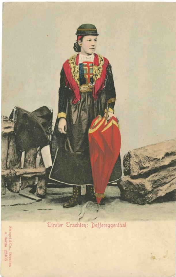
Stengel & Co. (Verleger) | »Tiroler Trachten, Deffereggenthal [!]«, Tirol zwischen 1897 und 1904 | Lichtdruck, handkoloriert, 11 × 8,9 cm (Postkarte)

Gibt es da nicht eine Verpflichtung zu einem methodischen, entpersönlichten Umgang mit den Objekten der Sammlung, die man betreut? Dürfen da die Affekte überhaupt zum Zug kommen?