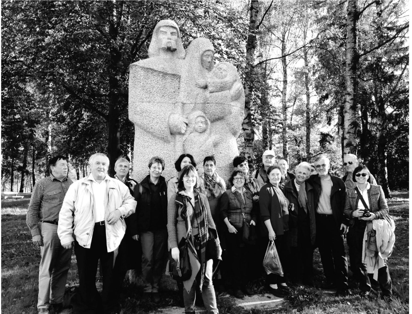
Gruppenfoto vor dem Denkmal für die im Barackenlager Gmünd begrabenen ukrainischen Flüchtlinge am Rande des ehemaligen Friedhofs des dort von 1915 bis 1918 bestehenden Flüchtlingslagers, enthüllt 1964.